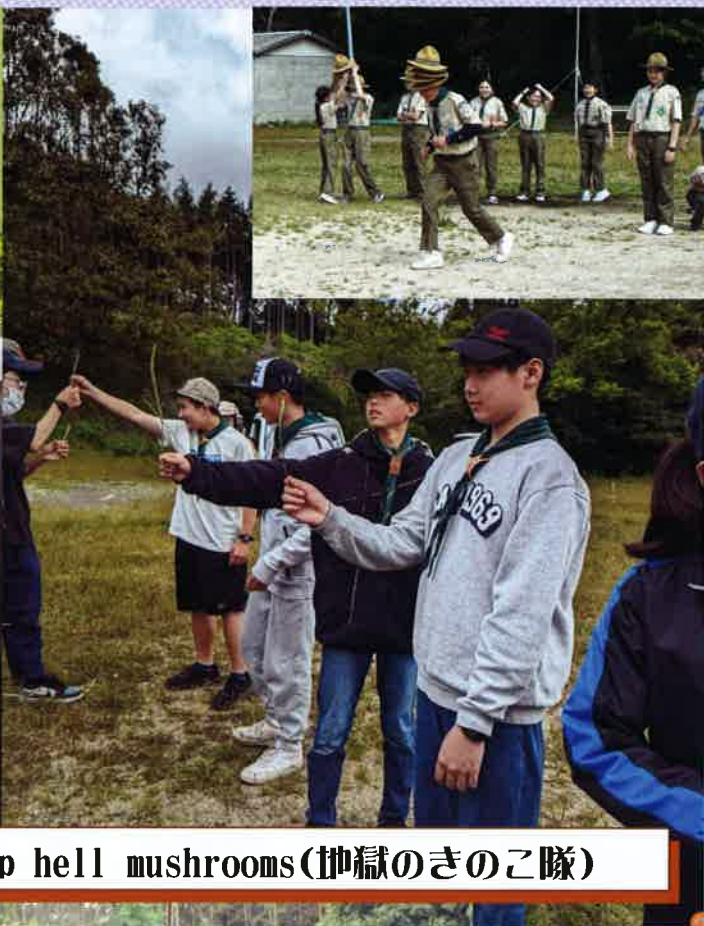
Troop hell mushrooms (地獄のきのこ隊)