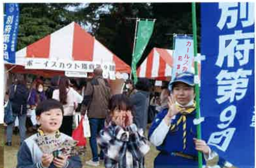
お店の宣伝に頑張るカブスカウト