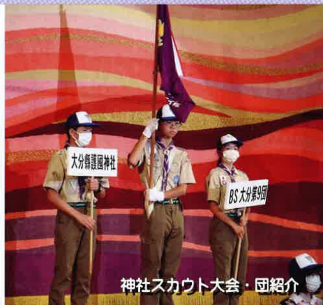
神社スカウト大会・団紹介

また、ボーイ隊は夏キャンプを2泊3日の日程で護国神社の境内の一部をお借りしておこないました。プログラムの一つの『鶴見岳登山』は保護者の方も参加しておこないました。日頃の感謝の気持ちを含めて、境内の清掃奉仕もプログラムの一つに入れ、楽しい活動ができました。