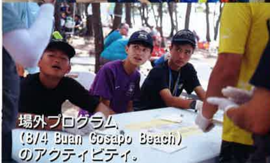
場外プログラム (8/4 Buail Gosapo Beach) のアクティビティ。