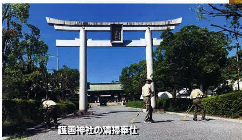
護国神社の清掃奉仕