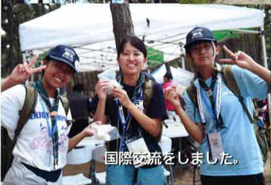
国際交流をしました。