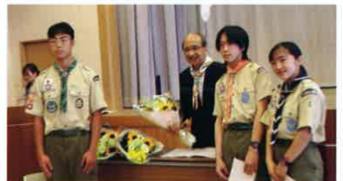
ベンチャースカウト代表

私たちスカウトは、これからも奉仕の心を忘れず、社会に役立つ人になれるよう、多くの仲間とともに活動を続けていきます。