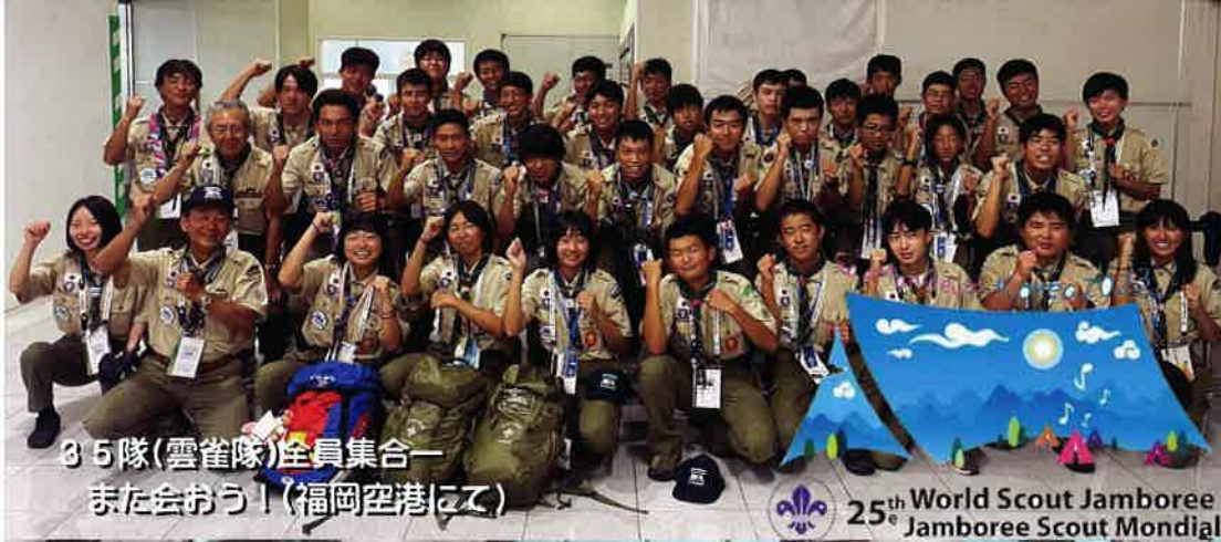
35隊(雲雀隊)全員集合ー また会おう！(福岡空港にて)

25 th World Scout Jamboree Jamboree Scout Mondial