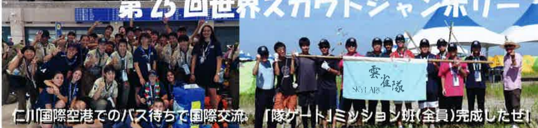
仁川国際空港でのバス待ちで国際交流。「隊ゲート」ミッション班(全員)完成したぜ！