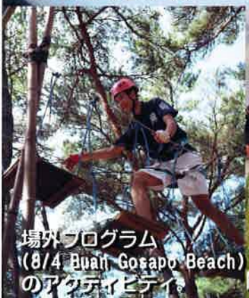
場外プログラム (8/4 Buail Gosapo Beach) のアクティビティ。