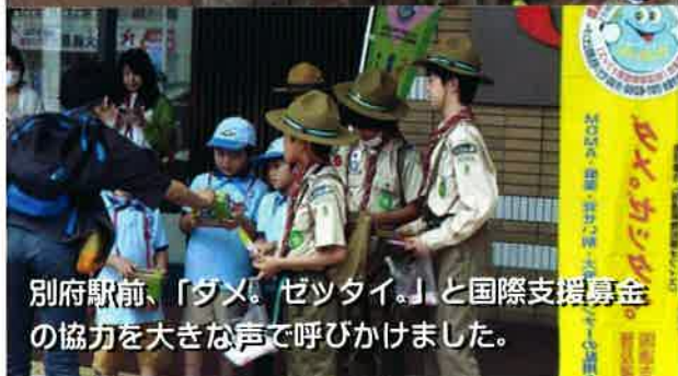
別府駅前、「ダマ。ゼツタイ。」と国際支援募金の協力を大きな声で呼びかけました。