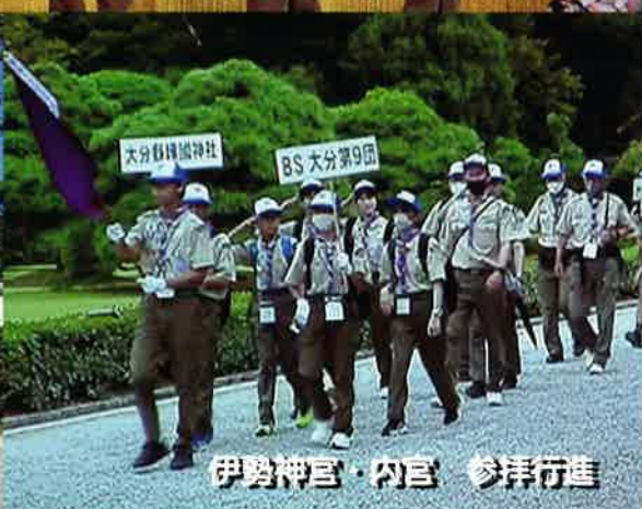
伊勢神宮・内宮 参拝行進