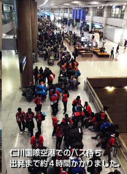
仁川国際空港でのバス待ち 出発まで約4時間かかりました。

25 th World Scout Jamboree Jamboree Scout Mondial