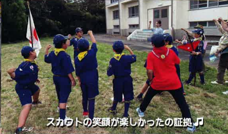
スカウトの笑顔が楽しかったの証拠♪