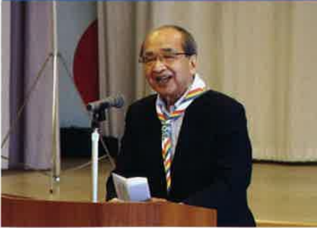
ビーバースカウト代表