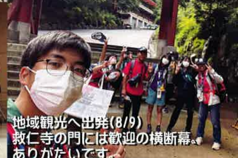
地域観光へ出発(8/9) 救仁寺の門には歓迎の横断幕、 ありがとうございます。