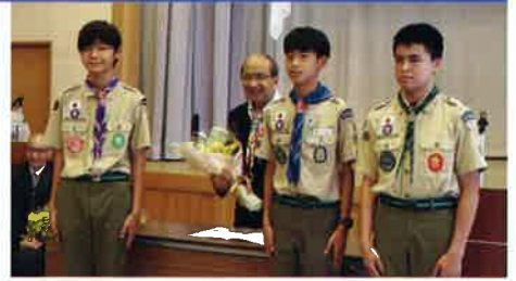
ボーイスカウト代表