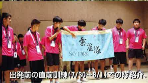
出発前の直前訓練(7/30~8/1)での隊紹介。