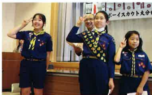
カブスカウト代表

広せ連盟長、今まで大分をよりよくしていただいてありがとうございます。私はカブ隊のぼ金活動で、人の役に立つことができました。これからもいろんなことにチャレンジして地域のためにかつどうします。連盟長、お元気におすごしください。