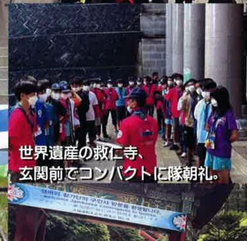
世界遺産の救仁寺、 玄関前でコンパクトに隊朝礼。