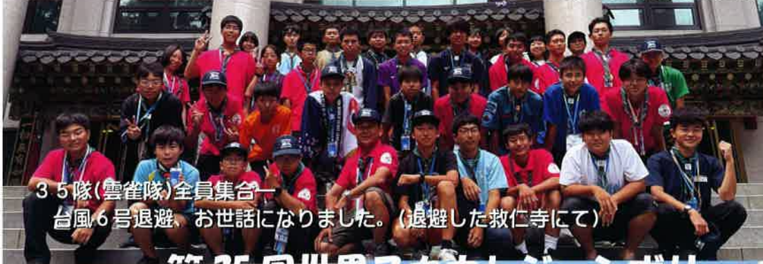
35隊(雲雀隊)全員集合ー 台風6号退避、お世話になりました。(退避した救仁寺にて)