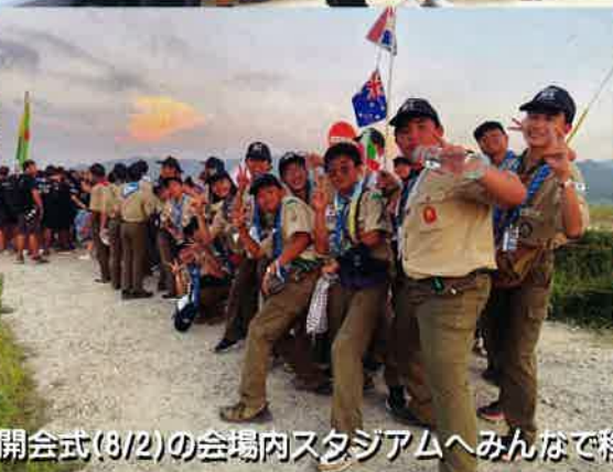
開会式(8/2)の会場内スタジアムへみんな移動。