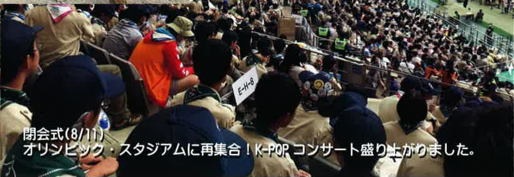
閉会式(8/11) オリムピック・スタジアムに再集合！K-POP コンサート盛り上がりました。