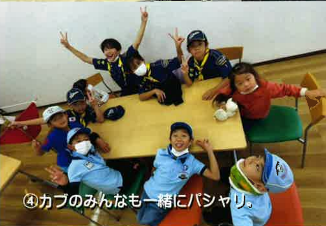
④カブのみんなも一緒にパシャリ。