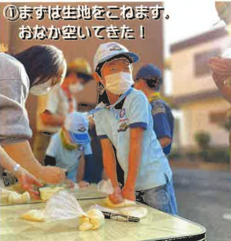
①まずは生地をこねます。おなか空いてきた！