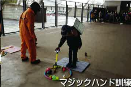
マジックハンド訓練