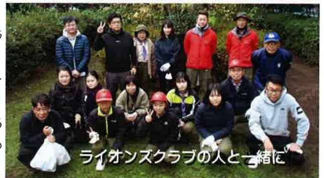
ライオンズクラブの人と一緒に

前回の清掃時は台風の後だったので、たくさんの葉が落ちていましたが、今回は落ち葉などのゴミの量はあまり多くありませんでした。