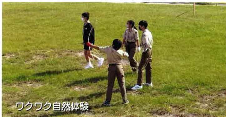
ワクワク自然体験