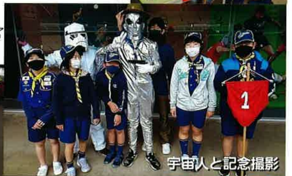
宇宙人と記念撮影