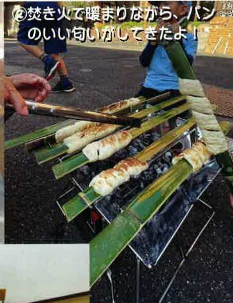
②焚き火で暖まりながら、パンのいい匂いがしてきたよ！