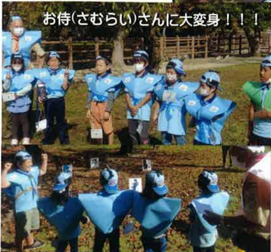
お侍(さむらい)さんに大変身!!!