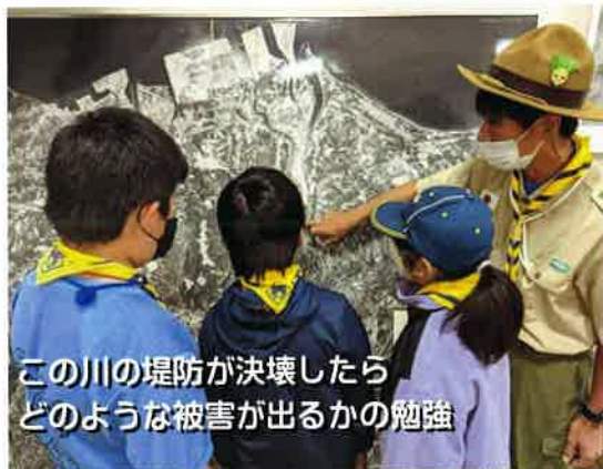
この川の堤防が決壊したらどのような被害が出るかの勉強

また、車中泊にも挑戦し体験しました。車中泊では寒さは感じませんでした。がフルフラットにならないので寝返りを打つたびに何度か起きた人もいました。まっすぐ寝れること、エアマットの重要性などいろいろなグッズが必要だと気づき貴重な体験ができました。