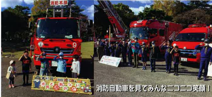
消防自動車を見てみんなニコニコ笑顔！