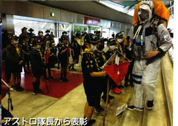
アストロ隊長から表彰