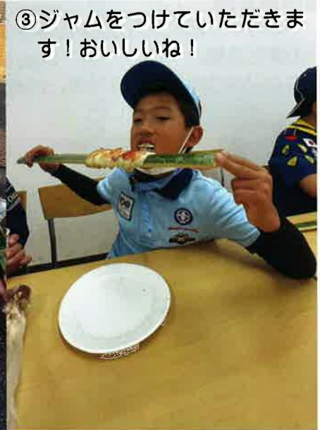
③ジャムをつけていただきます！おいしいね！