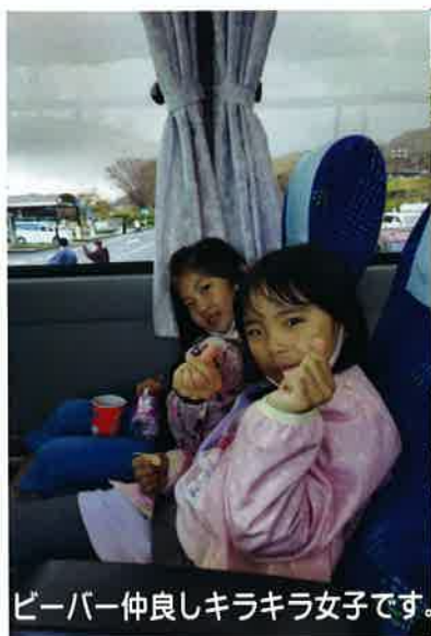
ビーバー仲良しキラキラ女子です。