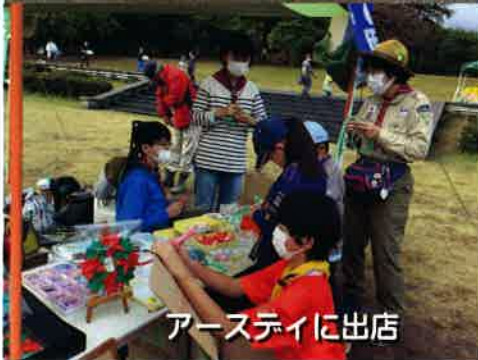
アースデイに出店

ついにアースデイでは、スカウトも出店。無料体験コーナーでは、お客さんと一緒に楽しみました。