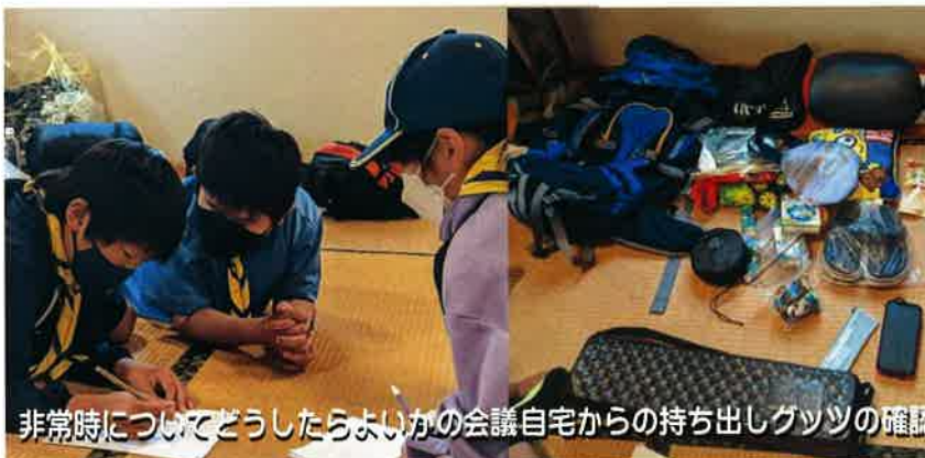
非常時についてどうしたらよいかの会議自宅からの持ち出しグッズの確認