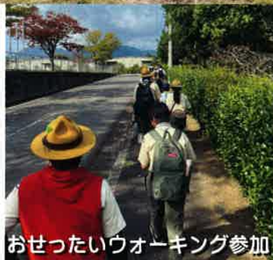
おせったいウォーキング参加