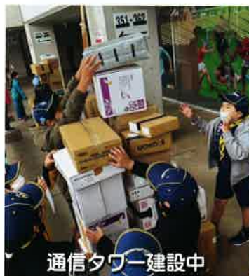
通信タワー建設中