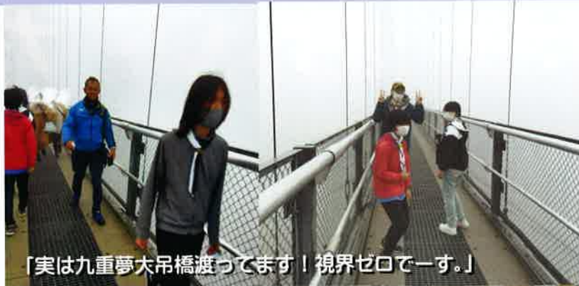
「実は九重夢大吊橋渡ってます！視界ゼロで一す。」

今年の団ハイクは、雨模様でコースを変更して、「九重長者原ビジターセンター」「八丁原地熱発電所見学」と、大分のいいところを見なおす機会となりました。