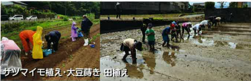
サツマイモ植え・大豆蒔き 田植え