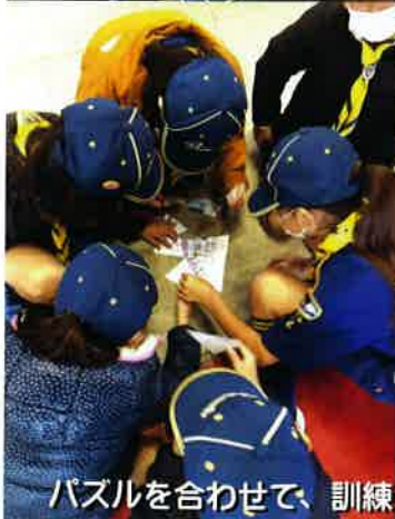
パズルを合わせて、訓練GO!