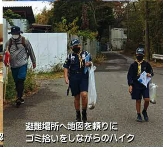
避難場所へ地図を頼りにゴミ拾いをしながらのハイク