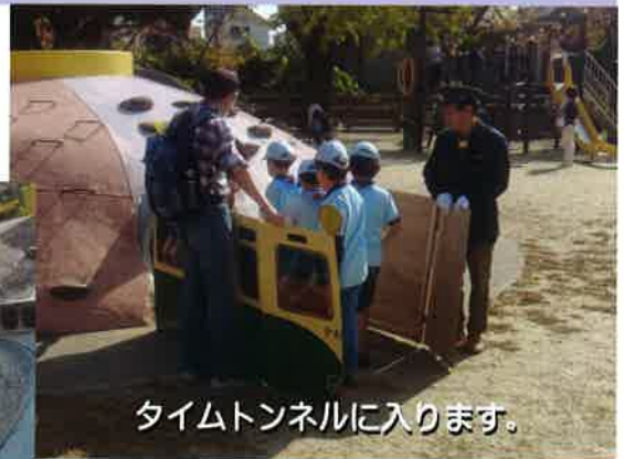
タイムトンネルに入ります。

中津市二の丸公園にて、「時をかけるビーバー」をテーマに開催しました。タイムトンネルをくぐったビーバースカウトたちは、江戸時代にタイムスリップ!!!