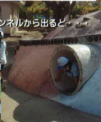
タイムトンネルから出ると...