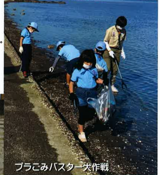
プラごみバスター大作戦