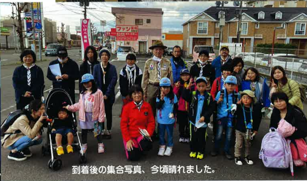
到着後の集合写真、今頃晴れました。