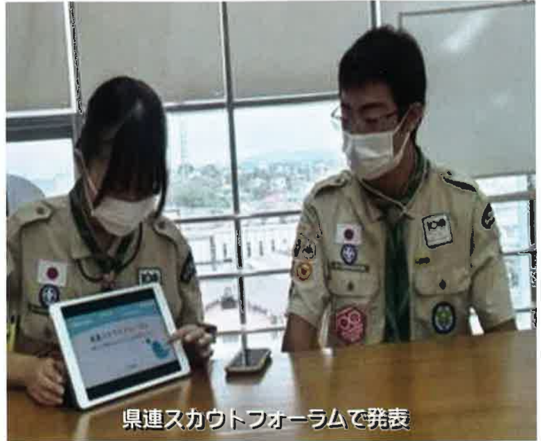
県連スカウトフォーラムで発表

県章取得に向けてスカウティングフォアボーイズを読み自分なりにまとめて隊長と話し合う準備をしています。