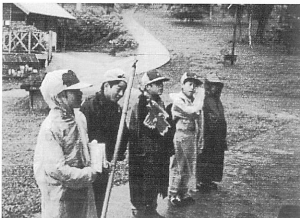
追跡ハイキングに出発するボーイ隊