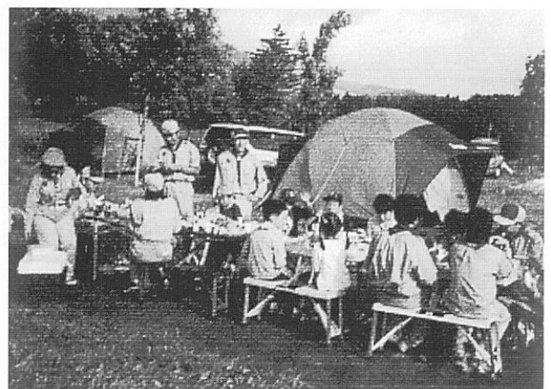
団キャンプみんな仲良く食事