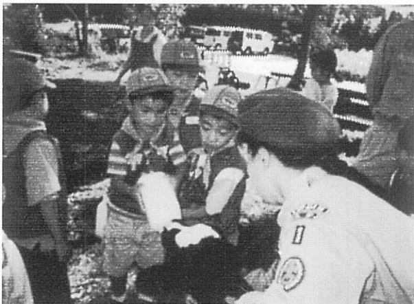
塚原高原ミルク村で子牛にミルクを飲ませているビーバー隊

活動中には町内外の方と接する機会が多いので、返事や言葉使いに気をつけ、ハッキリと会話ができる、助け合いの精神と奉仕の気持ち、それに我慢ができることをモットーとして活動に取り組んでいます。