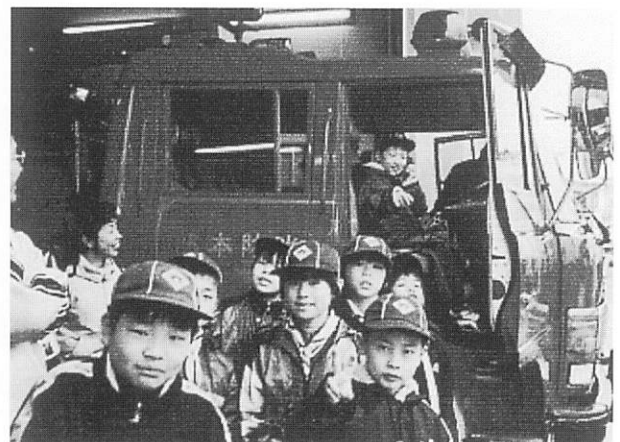
地域消防署で施設の見学をするカブ隊