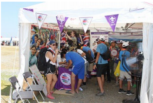
【次回の世界ジャンボリー紹介コーナー アメリカブースでした】