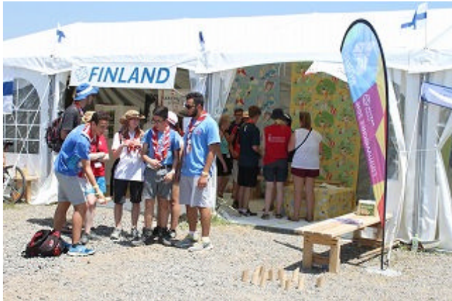
【フィンランドのブース前では 輪投げのようなゲームを楽しんでいます】