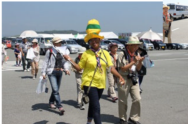
【到着したらインドの I S T スカウトの案内で場内を見学しました】