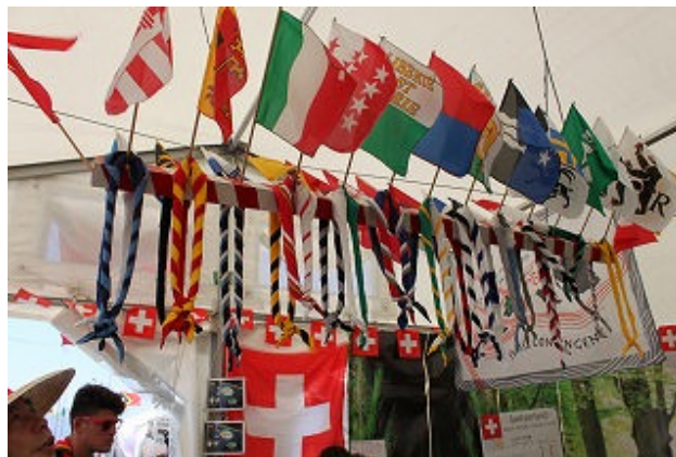
【スイスのブースでは、たくさんのチーフが展示されていました】