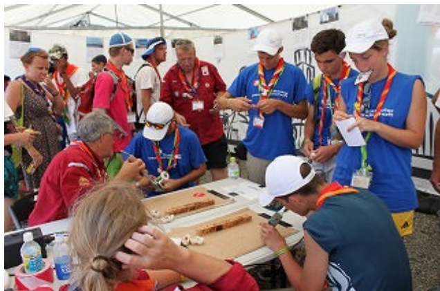
【オランダのブースでは、木靴のチーフリングの作成体験に長蛇の列でした】