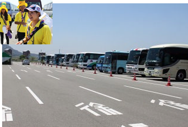
【広い広い駐車場で、はるか向こうまでバスが続いており歩くのにくたびれました】